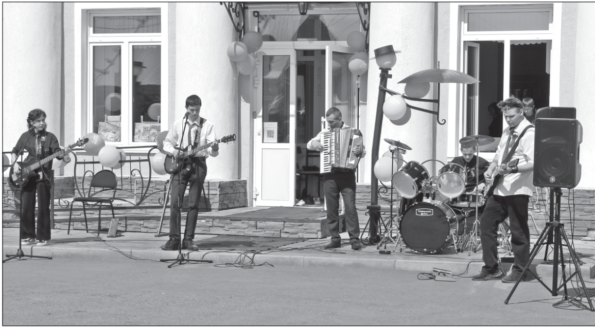
■ ВИА «ФактоРиал», 9 мая 2024 год.

Вокально-инструментальный ансамбль Детской школы искусств, созданный в этом году, набирает популярность