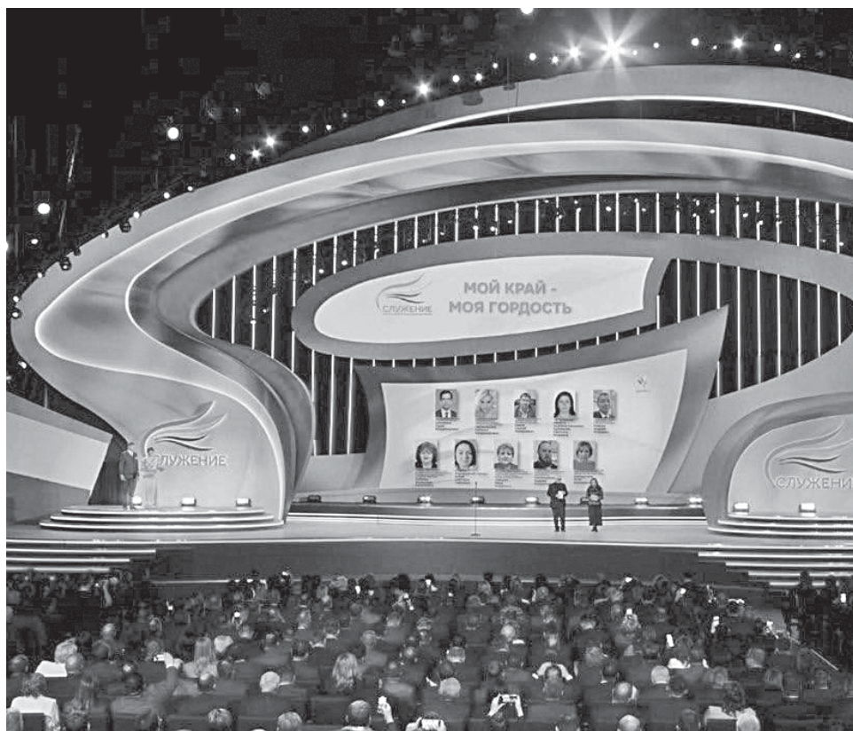
■ На церемонии награждения.