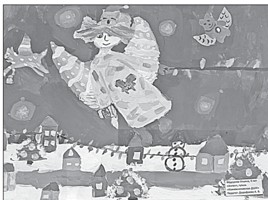
■ Рисунок Ульяны Фёдоровой.

учениц 3А класса КСОШ №2, Софьи Лихачёвой, ученицы 6Б класса КСОШ №1, Евы Ерошенко, ученицы 7В класса КСОШ №1 и Мирры Трифоновой, ученицы 8Б класса КСОШ №2 под руководством преподавателя школы искусств Алисы Витальевны Дорофеевой, которая поделилась мнением: