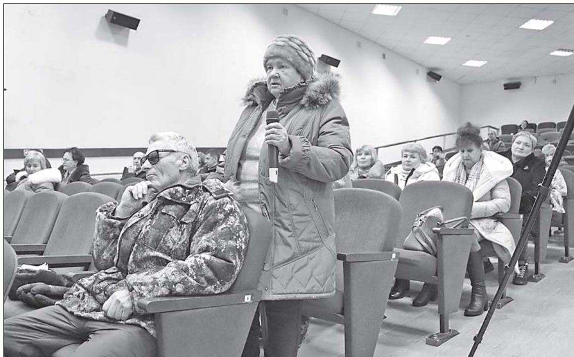
■ Жители Кожевникова задают вопросы.