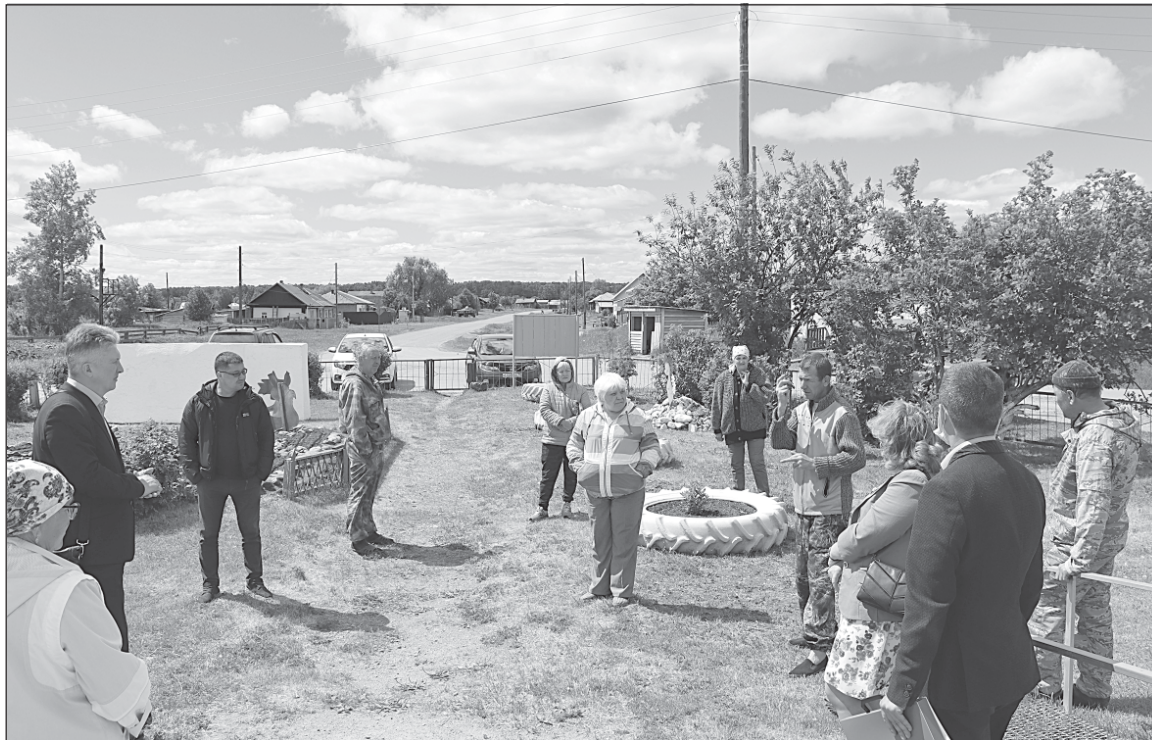
■ На встрече с жителями села Батурино.

Жители высказали свое мнение о необходимости детской площадки. В прошлом году в рамках программы «Инициативное бюджетирование» был реализован второй этап обустройства спортивной площадки в Чилине, своими силами оборудована площадка в Базое. Нынче ни один проект не набрал необходимого количества баллов. Как пояснила