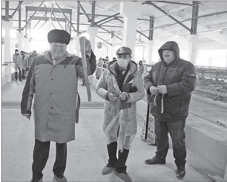
■ Долгожданный торжественный момент.

Как сообщил глава крупнейшего в Томской области молокоперерабатывающего предприятия «Деревенское