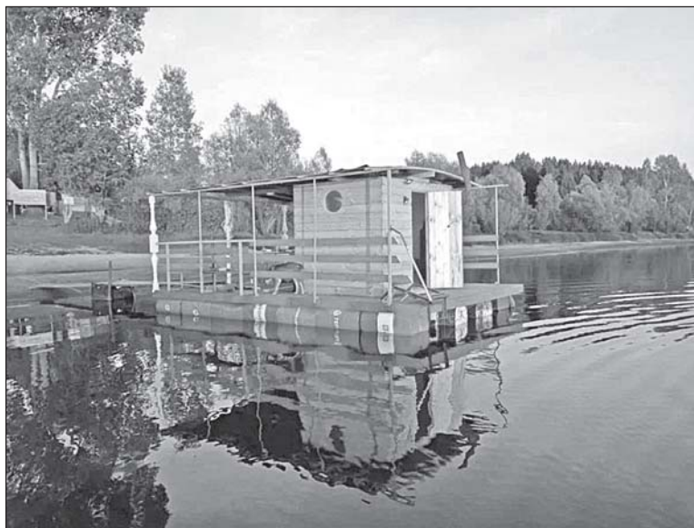
■ Плавучая сауна.