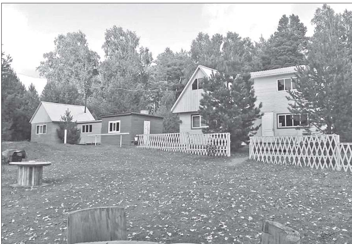
■ Домики на турбазе ждут гостей.