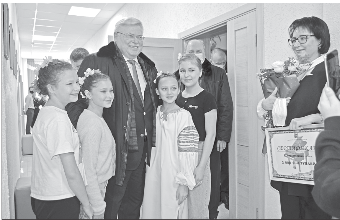
■ Губернатор радовался вместе с детьми.