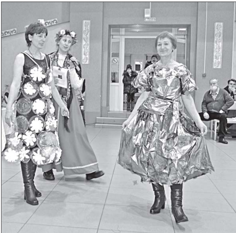
■ Дефиле Уртамского ДК.

Не менее интересным было творческое дефиле Уртамского поселения. Особенно впе-