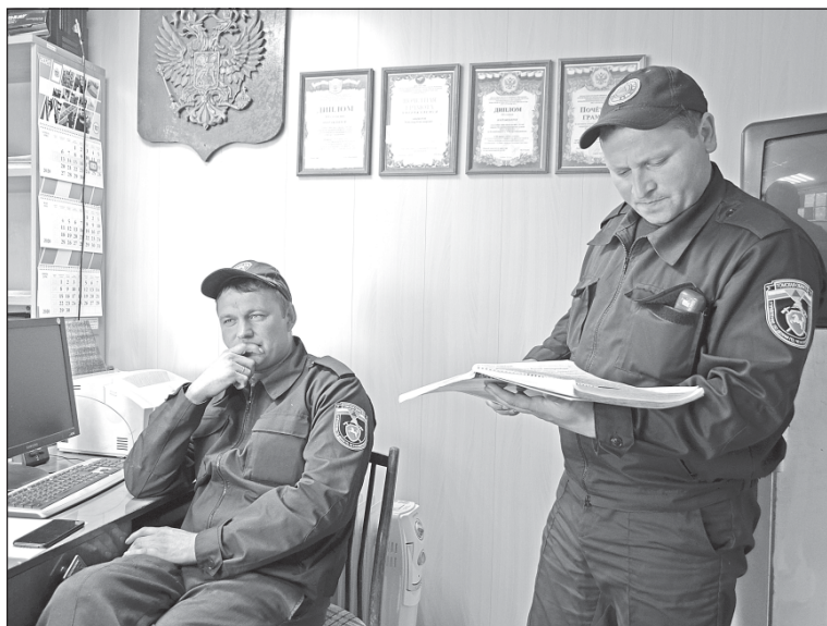
■ В караульном помещении.

стало больше ответственности, прикипели душой к пожарному делу. Главное – сложился коллектив, дружный и трудолюбивый, средний возраст - 37 лет. Защита людей вышла на первый план.