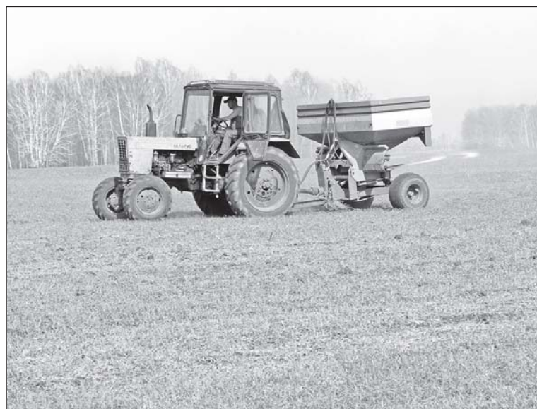
■ Внесение удобрений в почву.