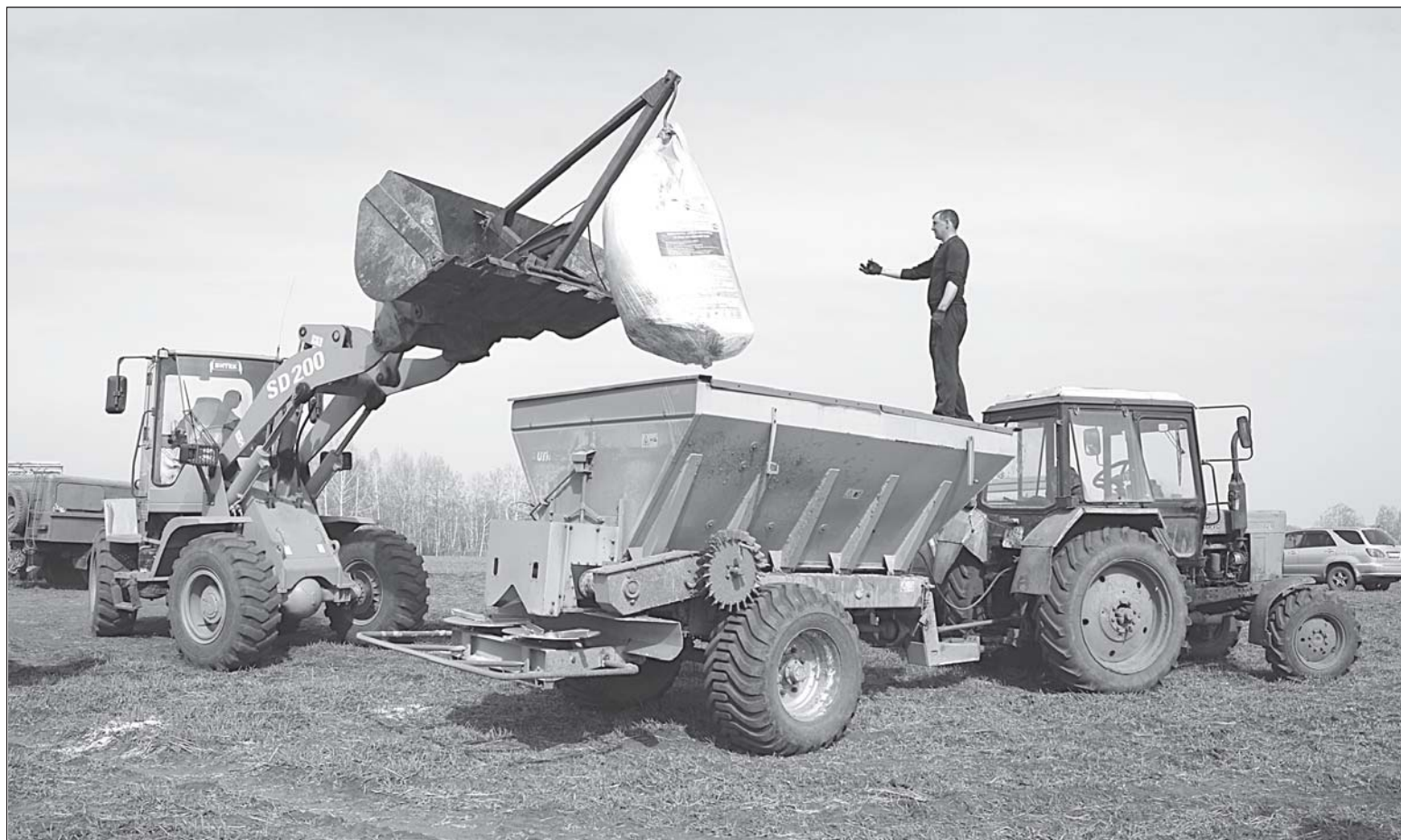
■ Процесс засыпания удобрений в емкость разбрасывателя минеральных удобрений.