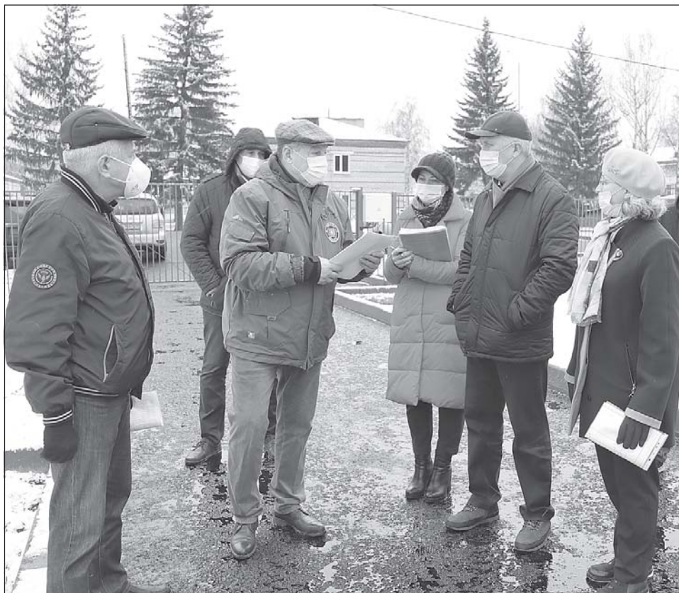
■ На территории детского сада «Колокольчик».