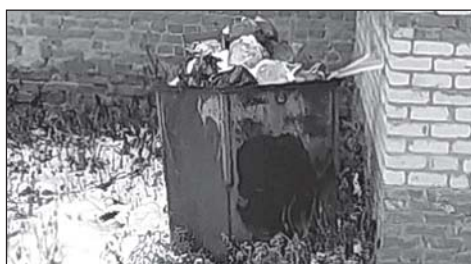
В Томской области идет обсуждение территориальной схемы обращения с отходами. 2 стр.

Подробности читайте в ближайшем выпуске газеты.