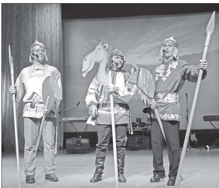
■ Творческий отчет Песочнодубровского поселения, 2019 год.