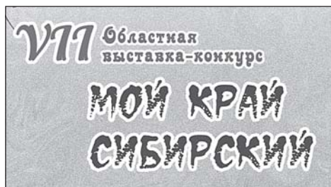
Кожевниковские ребята участвуют в конкурсах разного уровня. 6 стр.