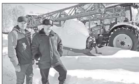
В сельхозпредприятиях района началась активная подготовка к новому сезону. 2 стр.