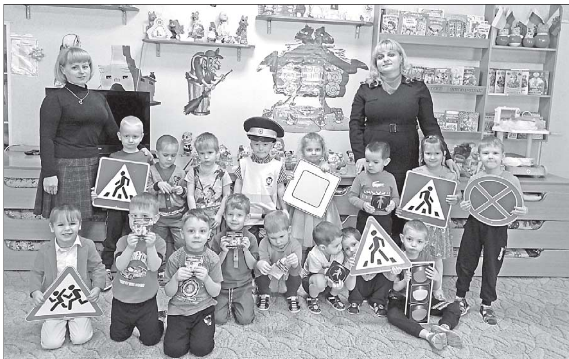
■ В детском саду «Солнышко».