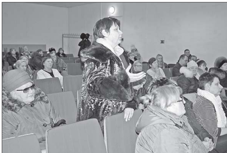
■ Жители просили разъяснить порядок платежей в Фонд капитального ремонта, обсуждали необходимость ремонта средней школы.

затраты на электроэнергию возросли, чтобы их уменьшить, частично заменили лампы на энергосберегающие. Значительный расход электроэнергии образуется из-за функционирования водоочистного комплекса. Могу сказать, большим спросом у населения вода не пользуется. В случае завершения строительства нового водопровода станция водоочистки нам не пригодится, ее можно будет установить в другом населенном пункте, где она будет более востребована.