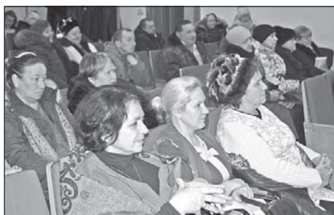
В Уртамском сельском поселении состоялся День администрации Кожевниковского района.

Глава района поинтересовался, как выполнены поручения с прошлого аппаратного совещания, в том числе результатами рейда в райцентре на предмет осмотра кровель зданий.