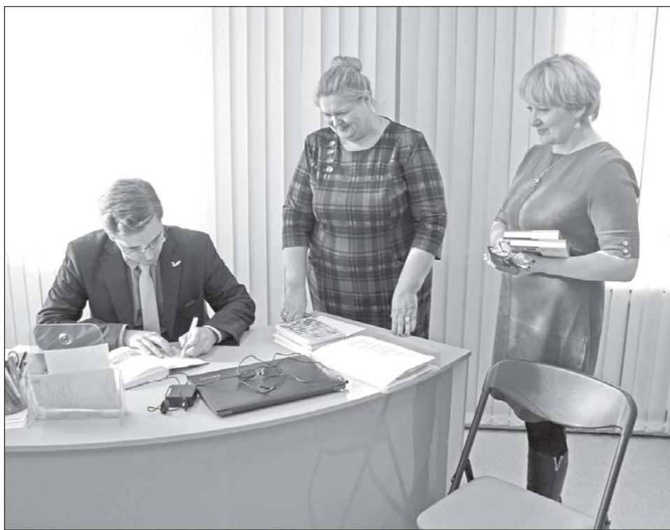
■ Автограф на память.