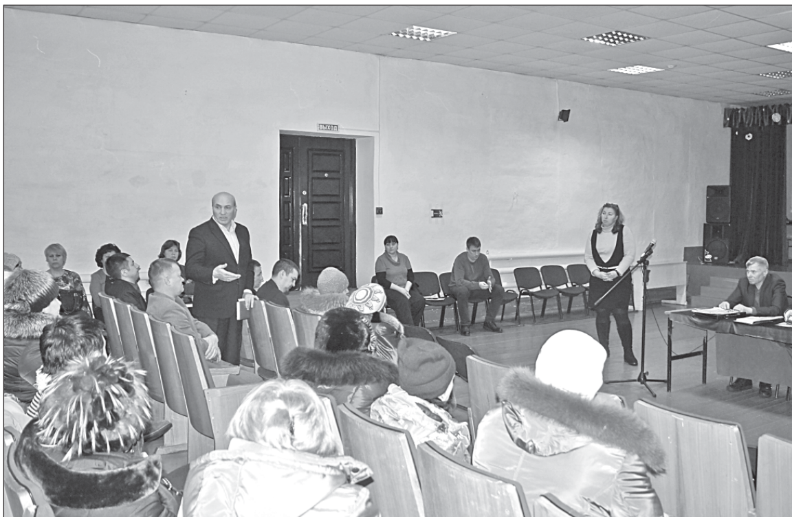
■ На встрече активно обсуждался вопрос о вывозе ТКО в поселении.

В 2019 году получилось решить еще один из наказов избирателей - заасфальтировать въездную зону в Уртам. Хотелось бы очистить рощу, чтобы село стало более привлекательным. Было уделено внимание модернизации уличного освещения. По просьбе родителей, учителей и воспитателей мы увеличили время работы фонарей. Не скрою,