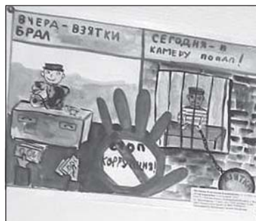
■ Рисунок Константина Филюшина.

В настоящее время в помещении прокуратуры района