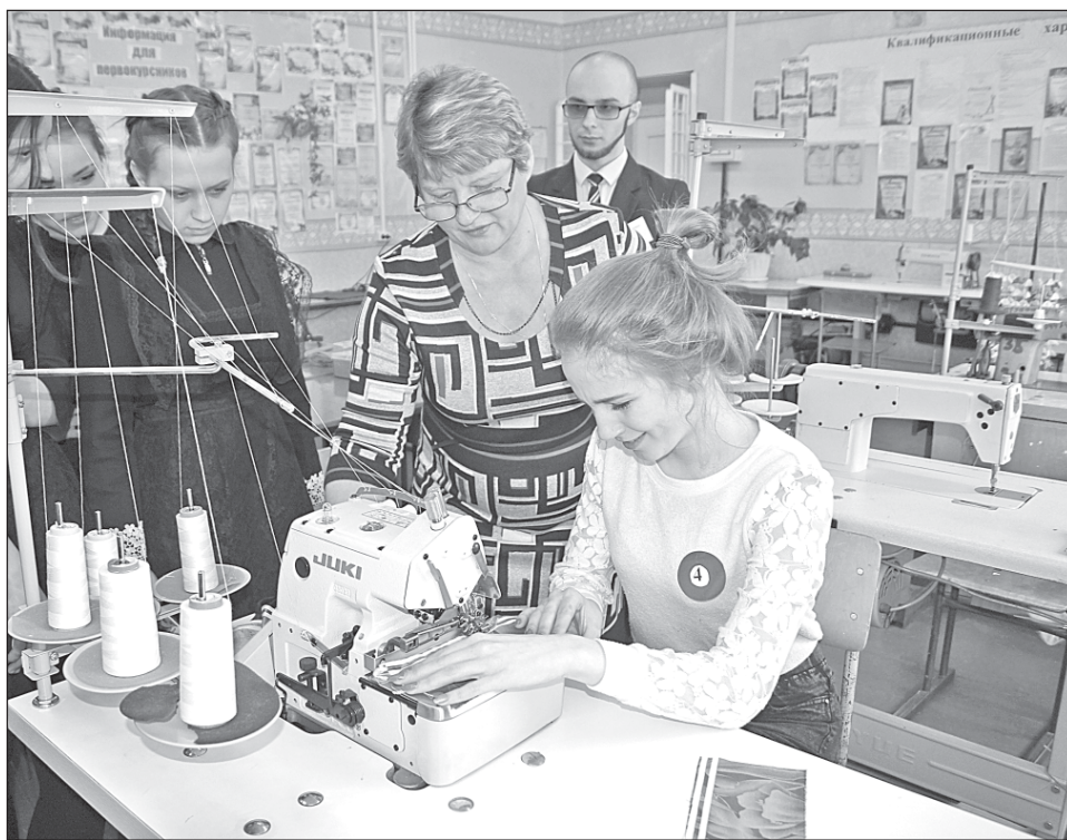
■ День открытых дверей в Кожевниковском техникуме агробизнеса.