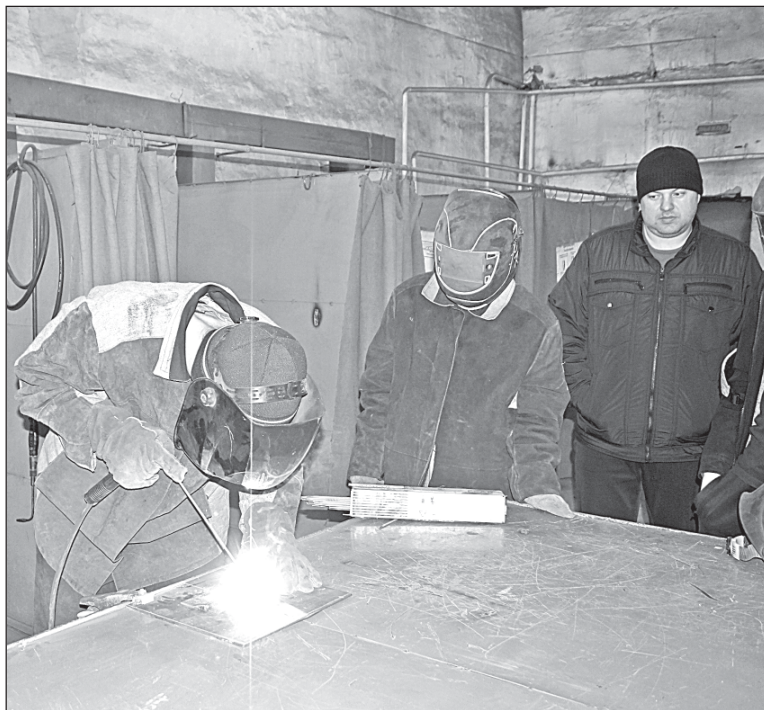
■ В настоящее время в Кожевниковском техникуме агробизнеса можно получить профессии швеи, продавца, электрогазосварщика, тракториста, водителя и др.

Для того, чтобы молодые люди, получив среднее профессиональное образование, пошли работать на предприятия, их нужно заинтересовать. Будет стабильная зарплата, достойные условия труда, возможность решить жилищный вопрос, тогда рабочая профессия станет престиж-