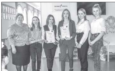
В КСОШ №1 прошел очный этап VI открытой научно-практической конференции «Шаг в будущее». 7 стр.

Мнения жителей района о престиже рабочих профессий читайте на 2 стр.