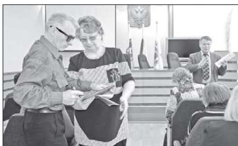
Состоялся итоговый пленум районного Совета ветеранов. Подробности на 3 стр.

Ранее сообщалось, что областной департамент труда реализует программы в поддержку занятости женщин, находящихся в декрете. Одна из них – курсы повышения квалификации и переподготовки по специальностям бухгалтера, кондитера, маркетолога и другим. В 2019 году 221 женщина, находящаяся в декрете, прошла переобучение или повышение квалификации. Также 482 мамы, искавшие работу, получили новую специальность.