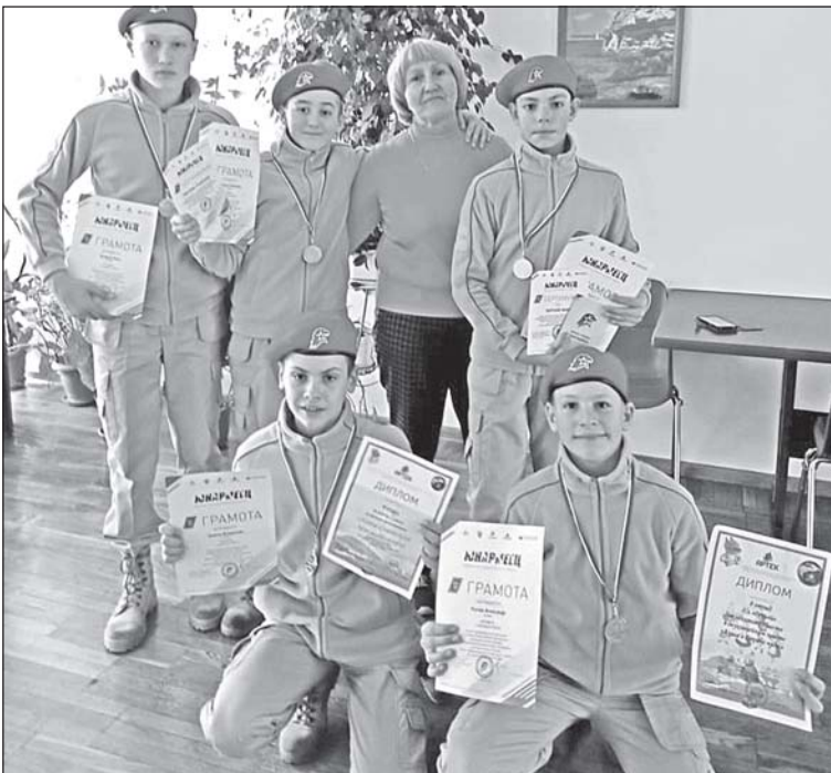
Юнармейцы КСОШ №2 с наградами из «Артека».

Юнармейцы КСОШ №2.