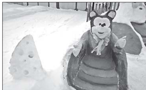
Перед Новым годом многие жители района украшают свои дома снежными фигурами. 7 стр.