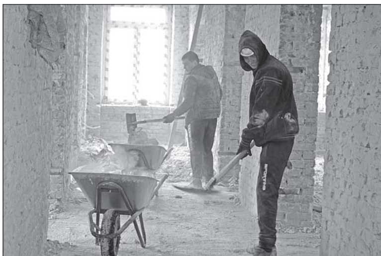
■ Снятие старой штукатурки.

специалистов со стороны выигравшей аукцион подрядной организации не было. Сейчас томским строителям приходится исправлять «косяки» тех, кто работал до них. На 7 октября проведено окончательное снятие внешней и внутренней штукатурки (было очищено на 30 процентов), вставлены стеклопакеты прежними подрядчиками, залили черновой пол на первом этаже, производится замена крыши, с сентября работают два электрика из Барнаула. На текущий момент главное – выполнить наружные работы (оштукатурить фасад, сделать кровлю), также оштукатурить стены и запустить отопление. В последнее время идут разговоры, что фасад здания будет изменен: обшит сайдингом или другими современными материалами. Но это не правда! Детская школа искусств сохранится после ремонта в прежнем архитектурном виде. Работы по монтажу «мокрого» фасада при неблагоприятных погодных условиях могут производиться с помощью уникальных технологий,