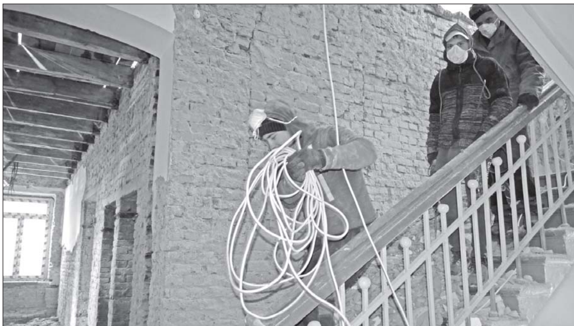
■ Электромонтажные работы.

(В следующем номере газеты мы расскажем о том, как организован образовательный процесс в ДШИ сегодня).