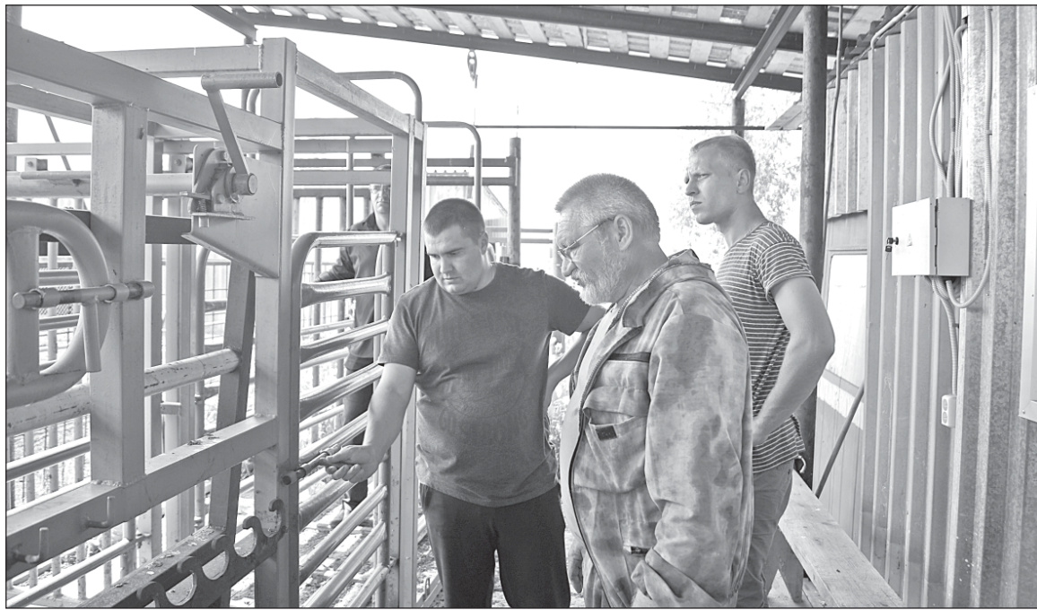
■ Гости знакомятся с новинкой фермерского хозяйства - расколом.

посетили крестьянско-фермерское хозяйство рогатого скота галловейской породы, новой опытом был организован администрацией