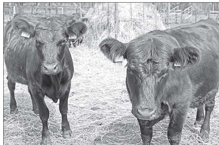
■ Галловеи – порода с мирным и покладистым характером.

Весной этого года произошли первые отелы, родились 35 телят. Они появляются не крупными, поэтому к минимуму сведен риск получения травм у нетелей. Специально построили родильное отделение, где «малыши» находятся в первые дни после появления. Нынче все идет к тому, что, скорее всего, надо ждать отелы в феврале-марте. Так даже и лучше, потому что в это время рождаются крепкие телята. Годовалый бычок достигает до пятисот килограммов живого веса. Осеменение происходит естественным способом. Есть два быка: Буян и Малыш. Вес каждого – более шестисот килограммов. Планируем купить новых быков. В области есть несколько хозяйств, занимающихся разведением галловейской породы, но там получение потомства осуществляется эмбриональной подсадкой.