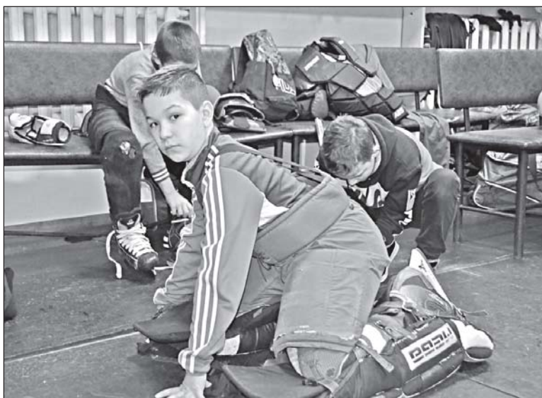
■ В раздевалке.

- Я родился в Томске 27 января 1956 года. В школьные годы увлекся хоккеем, посещал занятия в ДЮСШ. После окончания средней школы по-