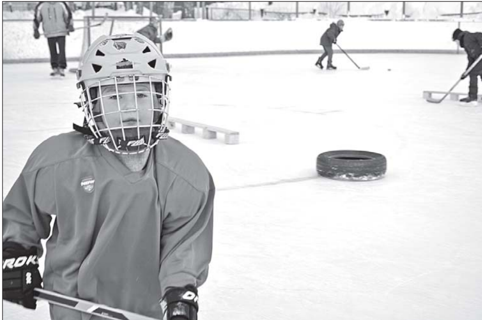
■ Мама, все в порядке!