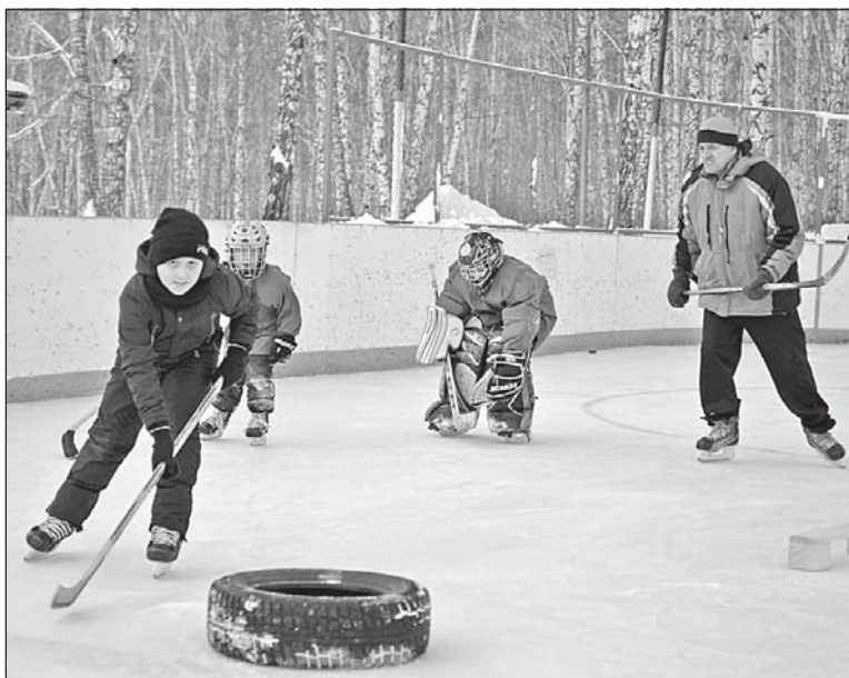
■ Азартные ребята.