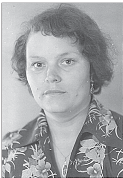
КСОШ №1 - 55

Продолжаем цикл публикаций к юбилею Кожевниковской школы №1