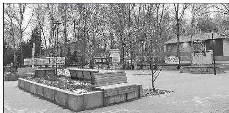
Программа благоустройства преобразует Томскую область. Подробности на 3 стр.