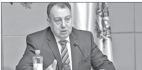
Заместитель губернатора А. Ф. Кнорр провел совещание по техническому оснащению хозяйств области. 2 стр.

– Благодаря заблаговременному заключению контрактов, мы раньше обычного начали дорожно-ремонтный сезон и выполнили поставленную вами задачу – не только в срок, но и качественно обновлять дороги, эффективно расходуя выделяемые средства. Томская область ранее была отмечена и в числе лидеров в стране по контрактации объектов и старту дорожно-ремонтной кампании. Сейчас мы уже активно ведем подготовку к следующему дорожному ремонтно-строительному сезону, – подчеркнул вице-губернатор.