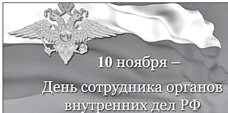
Поздравления и материалы, посвященные празднику, читайте на 4-5 стр.