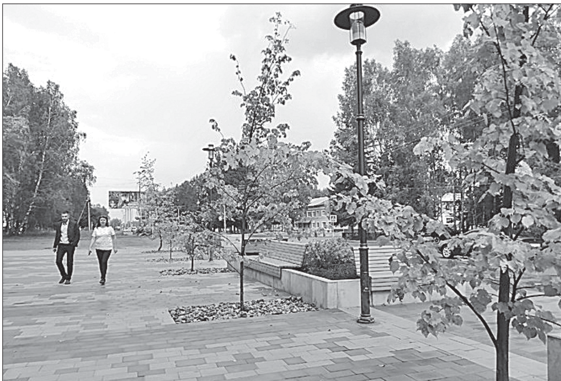
■ Сквер у ЦКиД в райцентре.

Стратегический подход к созданию новых скверов, парков, площадок для досуга и спорта – в этом году был адресным и стимулирующим. По национальному проекту в Томской области благоустроились 56 общественных пространств. Для этого из бюджетов всех уровней выделено 441,3 миллиона рублей. При распределении субсидии областная власть оценила показатели всех муниципалитетов за 2019 год. Лидеры – Стрежевой, Северск, Парабельский, Верхне-