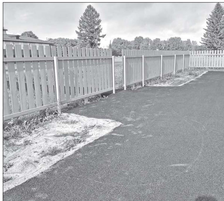
■ В Чилине идут работы по благоустройству детской спортивной площадки.

Площадка доступна всем, особенно пользуется спросом у детей, которые играют, катаются на велосипедах, самокатах по новой ровной дорожке. Надеюсь, что с началом учебного года на территории площадки будут проходить уроки физкультуры.