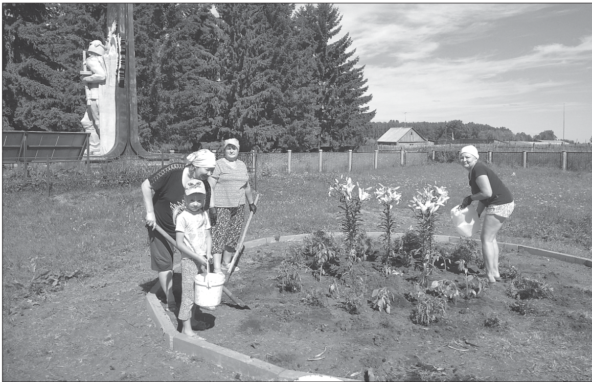
■ Благоустраивается сквер «Покровский».

С каждым годом хорошеют наши села, они становятся все привлекательней и краше. Навести порядок и уют – это забота как власти, так и каждого жителя