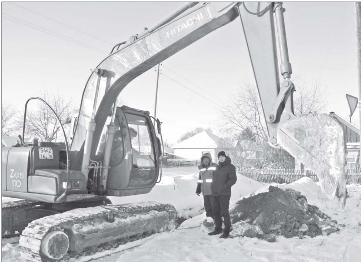
■ Идут работы по газификации.

- На участке водопровода по ул. Титова, №3, №5, №3А, №5А, из-за изношенности труб