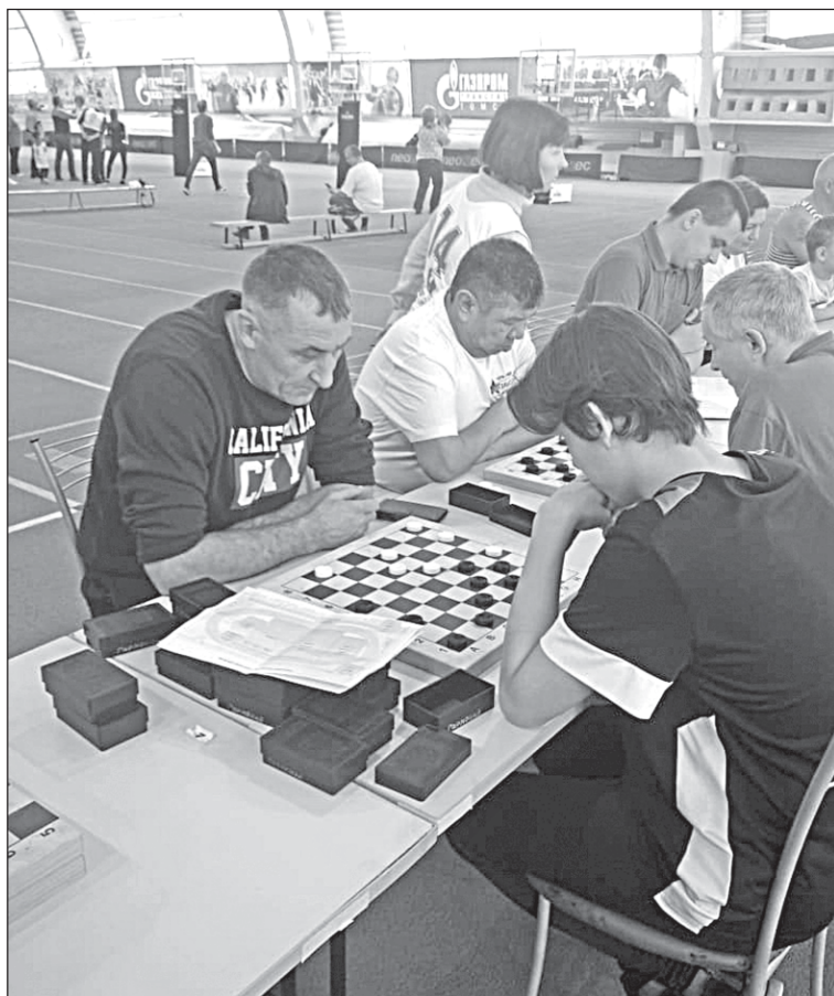
■ Игра в шашки.