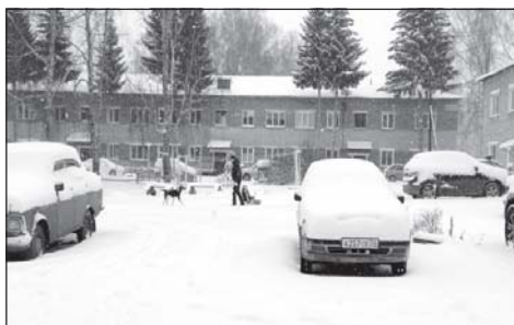
Как в поселениях встречают зиму, читайте на 2-3 стр.

В этот день у приехавших на фестиваль учителей и педагогов ДДТ состоялся плодотворный обмен интересными творческими идеями.