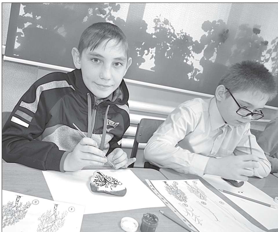
■ Увлекательный мастер-класс «Березка».