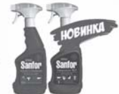
Sanfor спрей, 750 мл