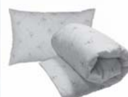
Подушки и одеяла