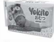
Японские подгузники «YOKITO»