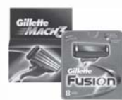
«МАШ 3», «Fusion» сменные кассеты