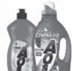
АОС ср-ва для мытья посуды и стирки