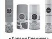
«Дореми Премиум» освежит 400 см3 (петро) 250 мл (сменный блок)