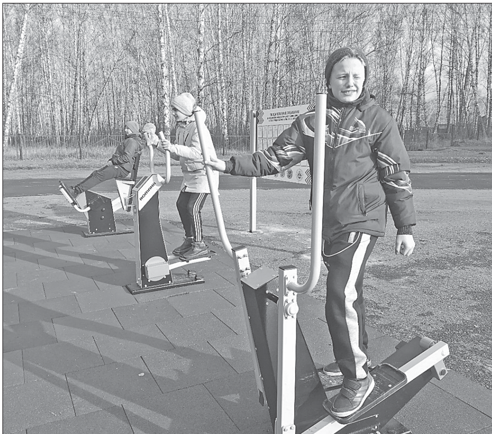
■ Площадка пользуется спросом.