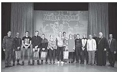
В ЦКиД прошли торжественные проводы новобранцев в ряды Вооруженных сил. 4 стр.