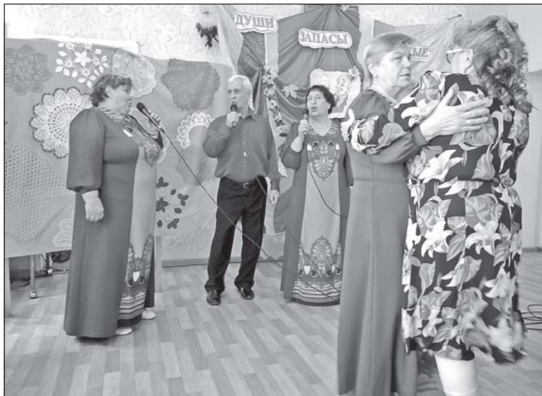
■ «Души запасы золотые».

26 сентября в Новопокровском ДК прошёл детский праздник «Осенняя карусель»: ребята инсценировали песню «Кленовый лист», читали стихотворения, отгадывали загадки, соревновались в эстафете и конкурсах. А 3 октября состоялась развлекательно-игровая программа «Осенний листопад». Ребята ловко прыгали по импровизированным лужам, разобрали на скорость красивые осенние листья и собрали пазлы-букеты. Все получили подарки. Середина октября для новопокровских ребятишек ознаменовалась фольклорным праздником «Покров-батюшка». Были и скороговорки с частушками, и подвижные игры, и чай с блинами.