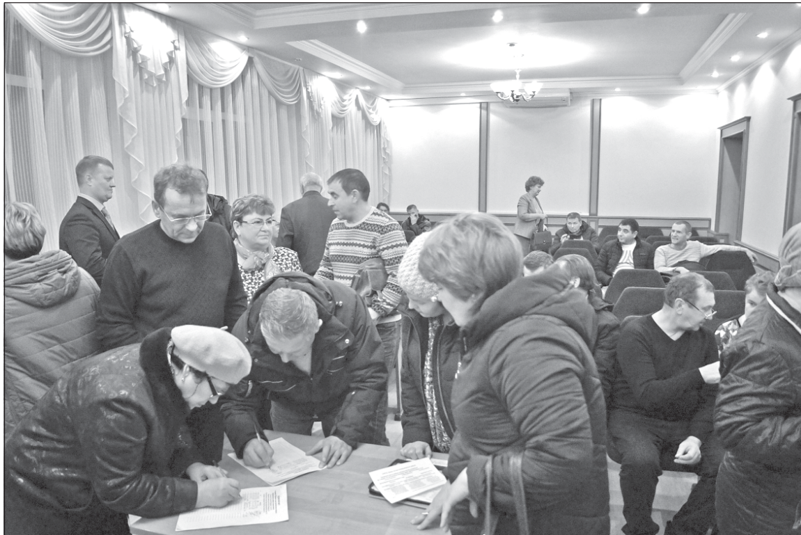
■ Предприниматели подписывают петицию.

Продолжаем мириться и с тем, что каждый год растет цена на бензин и дизтопливо, влияющая на транспортные расходы любого предприятия. Дважды в год растут цены на коммунальные услуги, на электричество и газ. Появляются десятки новых подакцизных товаров, число чипированных изделий растет, как снежный