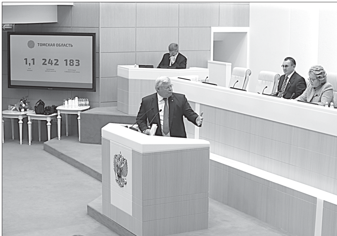
■ Губернатор Томской области попросил поддержки у палаты регионов.

Сегодня мы реализуем новые форматы интеграции науки и индустрии. Совместно с «Газпром нефтью» и «СИБУром» открыли кроссиндустриальный центр совместных технологических разработок. Дали старт проекту «Палеозой», который позволит получить новые технологии извлечения «трудной» нефти и существенно увеличить в дальнейшем объемы добычи по всей стра-