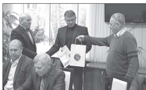
В администрации района прошло очередное заседание Совета территорий. 3 стр.

После ее открытия все желающие смогут сдать нормативы ВФСК «Готов к труду и обороне».