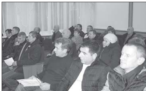
Предприниматели обсудили возможные последствия проведения кадастровой реформы. 5 стр.