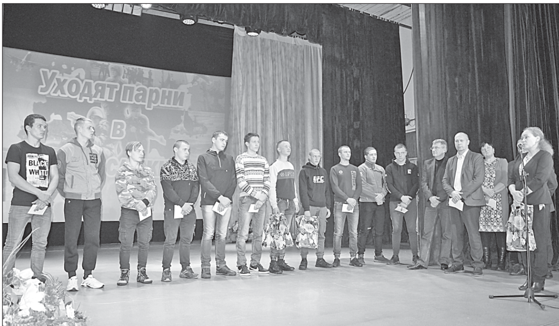
■ Главы поселений поздравляют новобранцев.