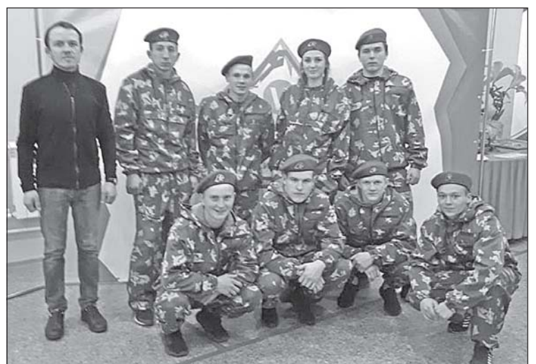
■ Команда техникума (снимок из архива).