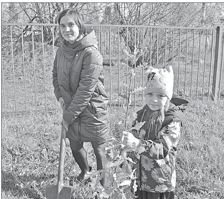
■ Расти, дубок!